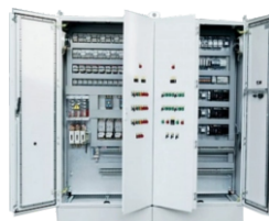
ПУЛЬТ УПРАВЛЕНИЯ ПУ-КПК-0,5

Устройство для измерения нагрузок с помощью тензометрических датчиков и узлов встройки. Используются для полуавтоматического контроля загрузки компонентов комбикорма, например в смеситель.