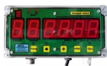
ВЕСОВОЙ ДОЗАТОР ЭВДУ-КПК

Вертикальные кормосмесители производят сбалансированный комбикорм по собственной рецептуре для животных и птиц сельскохозяйственного назначения.