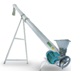
ТРАНСПОРТЕР ШНЕКОВЫЙ ТШ-200/1-6 Мощность: 2,20 кВт

Пульты управления оборудованием снижают влияние человеческого фактора до минимума. Это обеспечивается строгое соблюдение технологических процессов, что ведет к высокому качеству комбикормов.