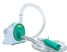
ЗЕРНОДРОБИЛКА ДКР-0,9 Мощность: 7,5 кВт

Решетные зернодробилки отличаются более точной калибровкой помола. Решето или сито подбирается под точные требования рецептуры, которые не всегда могут поддерживать дековые дробилки.