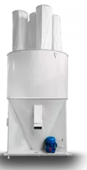
СМЕСИТЕЛЬ ССК-1,7 Мощность: 2,2 кВт / Объем: 1,7 м 3

Решетные зернодробилки отличаются более точной калибровкой помола. Решето или сито подбирается под точные требования рецептуры, которые не всегда могут поддерживать дековые дробилки.